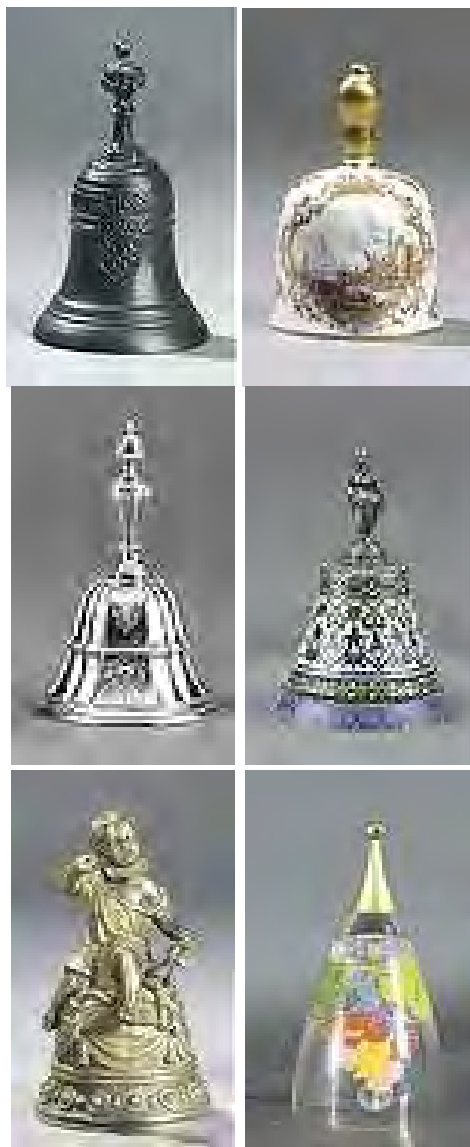
Фотографии колокольчиков коллекции Ланге

России профессор Йо Хаазен. Звучание мехеленского карильона, поистине сравнимо с „небесной арфой”. Именно Йо Хаазен был инициатором восстановления карильона в Петербурге» [15].