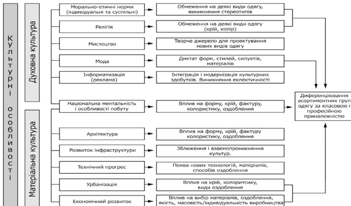
Рис. 2. Структурна схема впливу культурного розвитку території на костюм

дозволяють виявити сталі та змінні характеристики комплексів одягу заданого регіону, що в подальшому мають перспективу бути використаними як інструмент для формування рекомендацій щодо створення сучасного модного костюму із врахуванням культурно-територіальних особливостей.